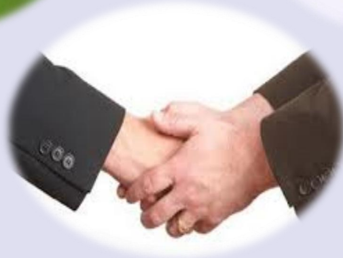
Politikacı El sıkışı (Uyanıklar, Eldiven)